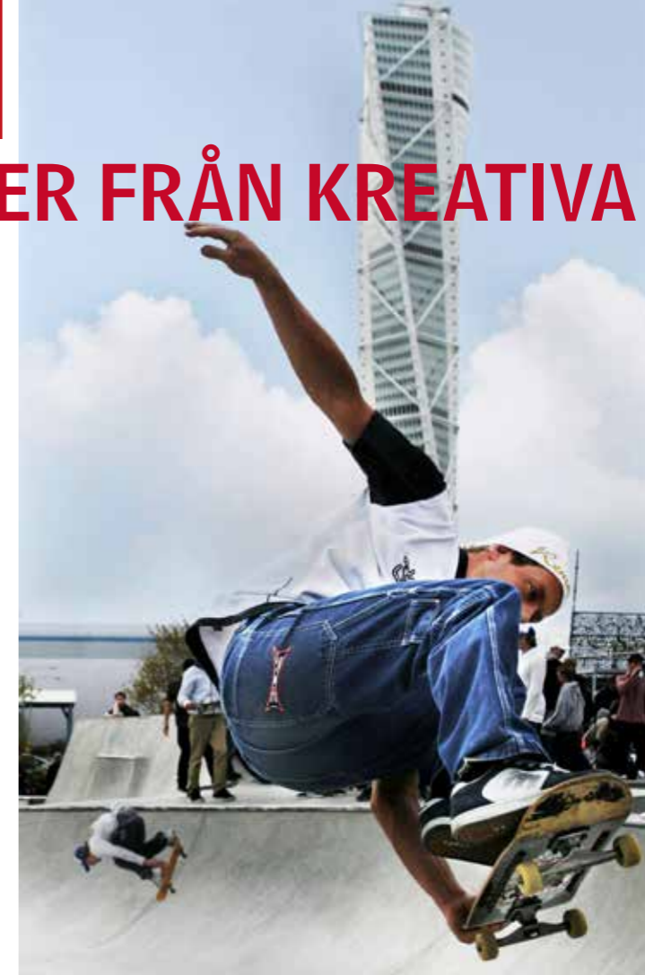
NORRA EUROPAS STÖRSTA utomhus-skejtspark med världscuptävlingar årligen finns på Kockums gamla industriområde i Malmö. Skejtsparken kom till efter ett samarbete mellan Malmö stad och en skejtförening där.

Som en av huvudtalarna under designveckan vill Ola Melin ge metropolen Hongkong nya infallsvinklar. Han ansvarar för stadsmiljön i Malmö och ser fram emot att berätta om sin "unga, djärva och nytänkande stad".