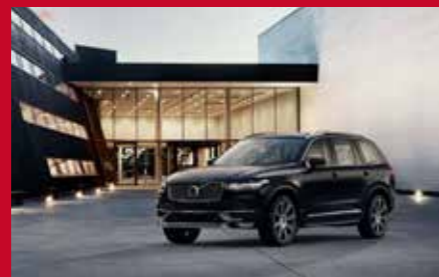
Svensk design i form av senaste suven Volvo XC90.

Bland stora kända svenska eller svenskrelaterade företag som ställer ut på designveckan i Hongkong märks Ankarsrum, Electrolux, IKEA, Scania, Sweco och Volvo personvagnar. Andra deltagare är till exempel Plantagon som ger framtidslösningar som att odla mat på skyskrapar, och ergonomidesignföretaget Veryday som i Milano fått designvärldens Nobelpris. Dessutom medverkar Teknikföretagen och Region Skåne/Malmö stad med egna avdelningar. Invest Skåne har med sig ett tiotal företag i en särskild monter.