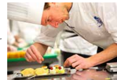
KOCK i Nobelköket i Stadshuset 2013.

Culinary Training Centre i Hongkong svara för ett nyskapande gatukök à la Nobel.