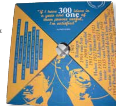
MINGELVÄNLIG MATLÅDA för Nobelmaten med information om Nobelpristagare och fyra fack varav tre för maten. I det fjärde facket går det att trycka ner en burk, en flaska eller ett glas för dryck.

En kock, tidigare student vid restauranghögskolan i Grythyttan, ska tillsammans med en kock och fem studenter från Chinese