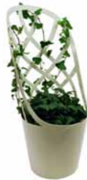
PRODUKT My Trellis DESIGN Johanna Strand År 2011

KOMMENTAR Vi kände inte till den produkten. Det är väl mer tråkigt för den som gör det, det kan inte vara kul att göra något som redan finns. Men krukor skiljer sig lite, vår kan också användas som rumsavdelare.